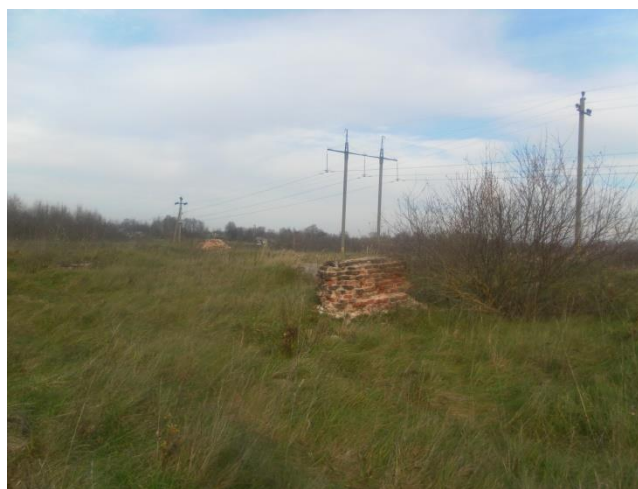
Рэшткі фундамента царквы Святога Мікалая

Па дарозе на Цяпіна, з левага боку побач з дарогай, знаходзяцца рэшткі фундамента царквы Святога Мікалая, пабудаванай ў 1859 годзе з цэглы. Царква была знішчана ў першыя дзесяцігоддзі Савецкай улады, падчас бяздумнай барацьбы з рэлігіяй.