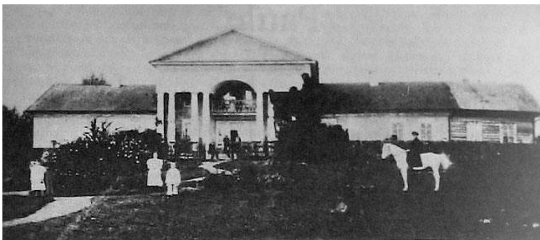
Маёнтак Павулле (фота 1917 г.)

Далей маршрут ідзе ў напрамку вёскі Навасёлава. Для вёскі Навасёлава раней знаходзіўся маёнтак Павулле (Двор Павулле).