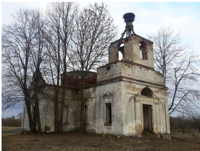
Царква Святога Мікалая

Адпраўляемся далей па маршруце. Недалёк ад Чашнік знаходзіцца вёска Браздзецкая Слабада. Тут мы зможам пазнаёміцца з царквой Святога Мікалая.