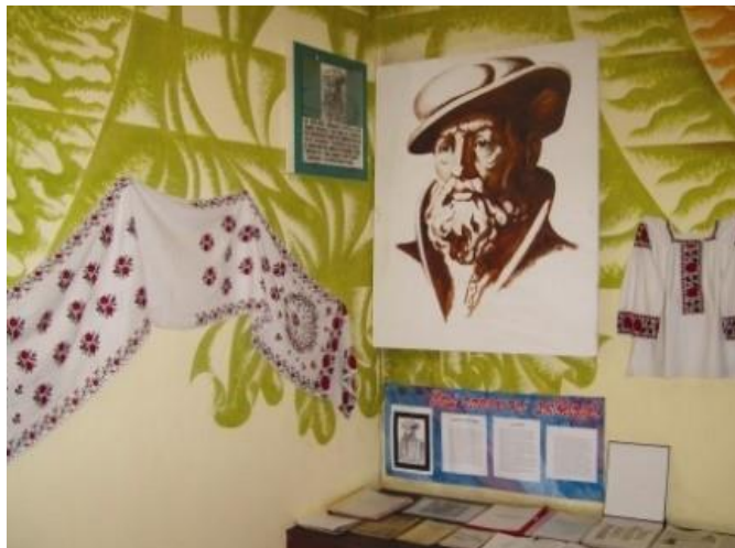
Экспазіцыя, прысвечаная жыццёваму і творчаму шляху В.Цяпінскага

У 2020 годзе спаўнілася 480 год са дня нараджэння В.Цяпінскага. У планах ініцыятыўнай групы, зацікаўленай у захаванні памяці аб славым земляку, стварэнне турыстычнага аб'екту “Сядзіба Васіля Цяпінскага”, правядзенне фестывалю “Дзень Васіля”, які плануецца зрабіць брэндам раёна. Ужо зроблены першыя крокі ў гэтым накірунку. Мясцовая ўлада выдзеліла надзел зямлі на беразе жывапіснага возера, дзе плануецца разбіць парк, зрабіць пляцоўку для фестывалю. Адноўлена “Васілёва крынічка”, пабудавана альтанка.