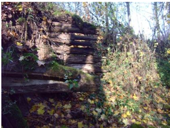
Рэшткі муроў млына

Шмат чаго цікавага знаходзіцца ў наваколлі вёскі. Напрыклад рэшткі муроў млына.