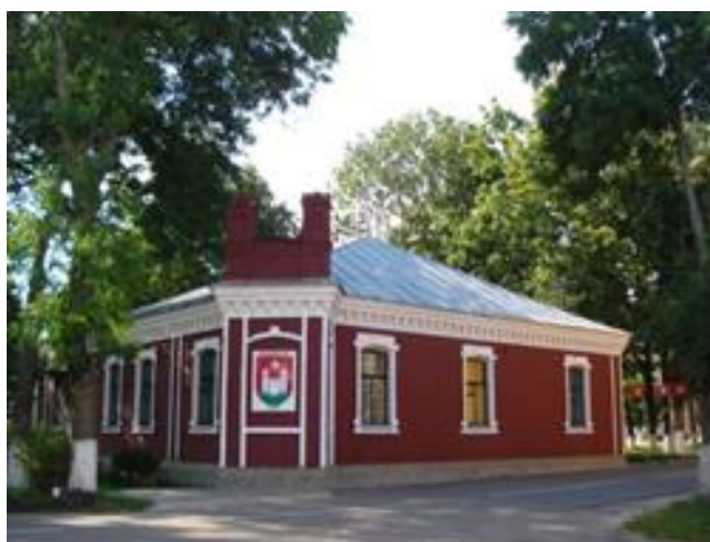
Будынак Чашніцкага гістарычнага музея

Чашніччына мае шмат цікавых мясцін. І першы пункт нашага прыпынку будынак, у якім раней размяшчаўся Чашніцкі гістарычны музей.