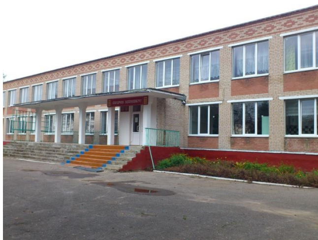
ДУА “Цяпінская дзіцячы сад-сярэдня школа Чашніцкага раёна”

А наш маршрут пралягае ў Дзяржаўную ўстанову адукацыі “Цяпінская дзіцячы сад-сярэдня школа Чашніцкага раёна”.