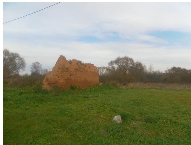
Рэшткі пабудоў маёнтка Павулле

Рухаемся далей па маршруце. Наступны прыпынак – месца стварэння Лепельскага партызанскага атрада. Далейшы шлях пераадолеем пешшу, або на веласіпедах. За 2 км ад вёскі Васькаўшчына, у лесе, на мяжы Лепельскага і Чашніцкага раёнаў знаходзіцца месца былога партызанскага лагера. У жніўні – верасні 1941 года ў лясах Лепельскага і Чашніцкага раёнаў з мясцовых патрыётаў і чырвонаармейцаў, якія трапілі ў акружэнне, былі створаны